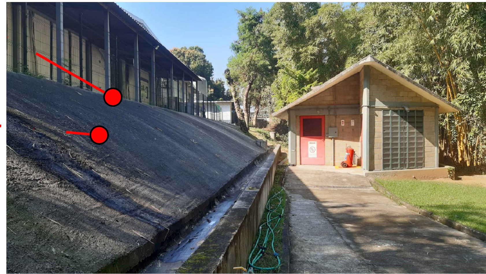
4 FOTOS DO LOCAL