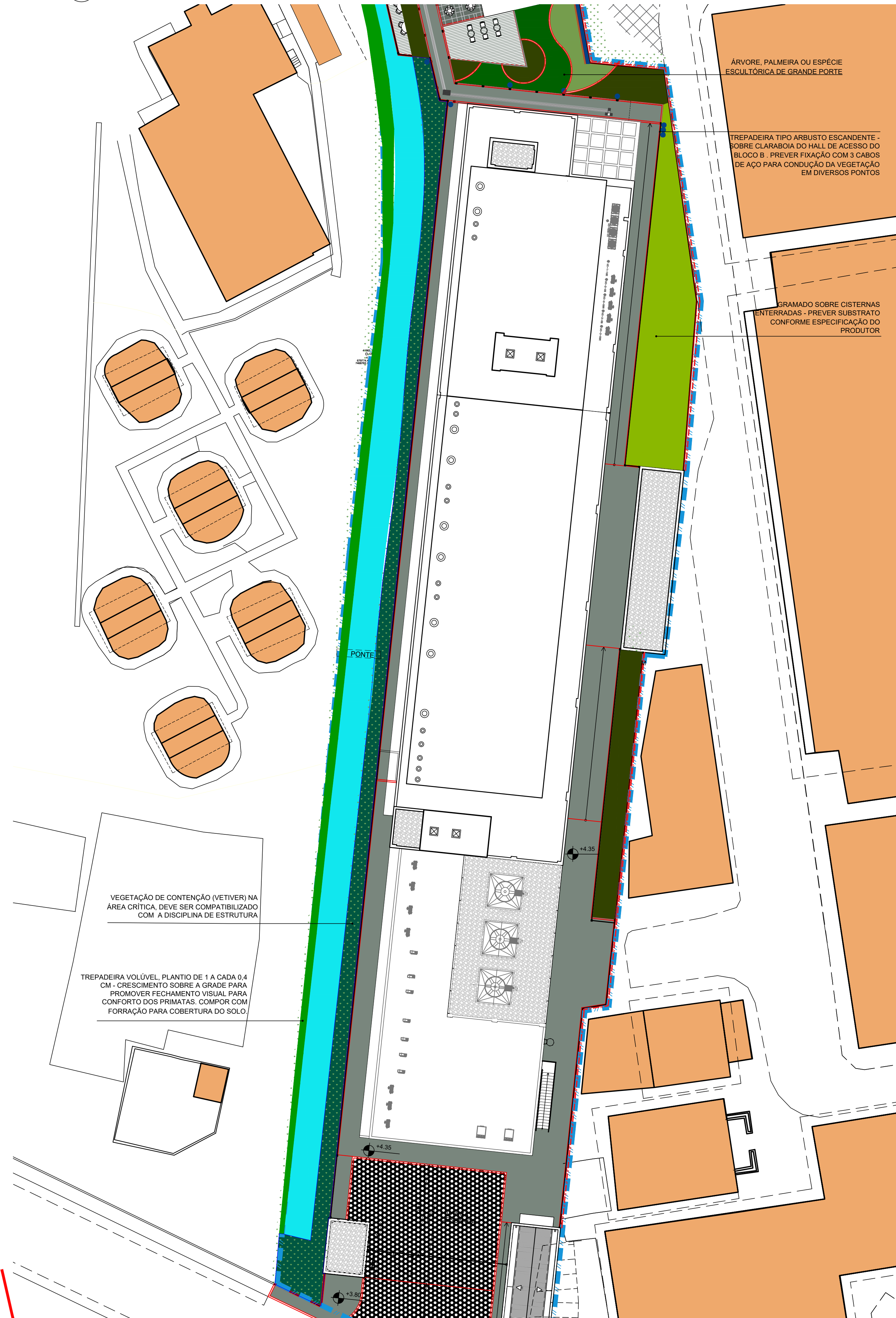
3 PAISAGISMO - TRECHO 2 ESCALA 1:250